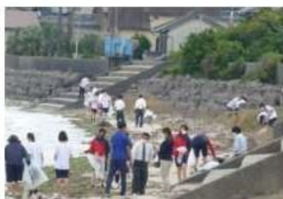
河和海岸の清掃の様子です。