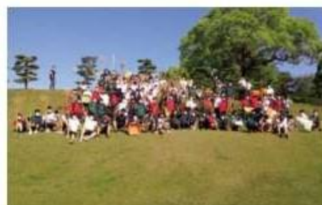
毎回たくさんの生徒が参加します。