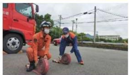
インターンシップで就業体験をしています。