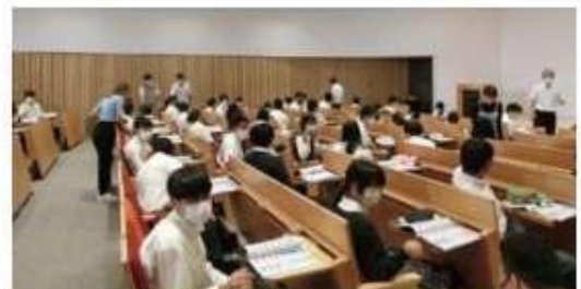
2年生の校外活動（大学見学）の様子です。