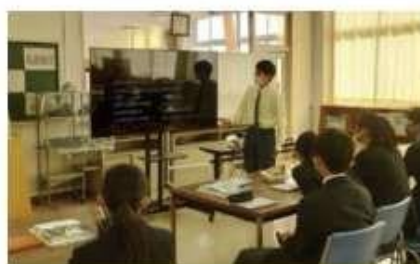
校内発表の様子です。