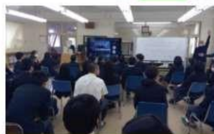
他校と交流会をしている様子です。