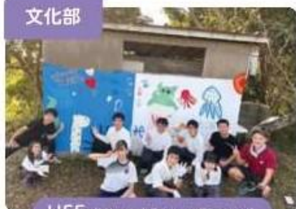
UFF (Utsumi Future Factory)