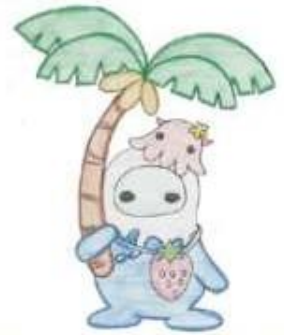
内海高校マスコットキャラクター いちうくん