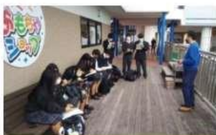
南知多ビーチランドでお話を伺っている様子です。