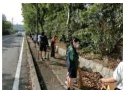
「地域と歩むボランティア」の様子です。