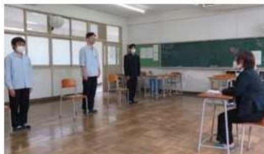
「進路対策講座」で集団面接の練習をしています。