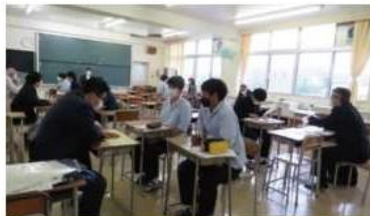
「3年生進路ガイダンス」の様子です。

外部から講師を招き、進学や就職に関する基礎的な理解を行い、高校生活の過ごし方について考える内容です。